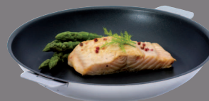
Anti-adhérent Excalibur® Reinforced non-stick coating