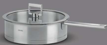
Strate fixe “L”