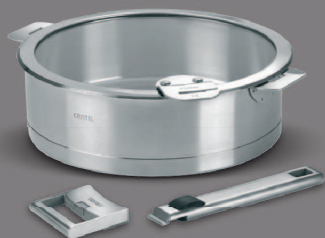
Strate amovible “L”