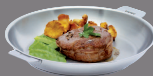
Inox Stainless steel